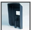
MASQUE DE SOUDURE CE